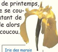
Iris des marais

La Réserve Naturelle Volontaire est caractérisée par des sols dits hydromorphes. Sur ce substrat gorgé d'eau se développent de nombreuses plantes. Parmi les 111 espèces végétales inventoriées, certaines sont protégées et/ou menacées de disparition dans le Nord/Pas-de-Calais comme l'Orchis négligé, la Valériane dioïque ou le Scirpe des bois. Dès les premières semaines de printemps, le Vallon de la Petite Becque se couvre de fleurs. Le jaune éclatant de l'Iris et du Populage se mêle alors au rose du Lychnis fleur de coucou.