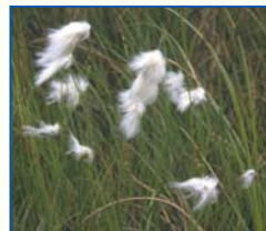
Linaigrettes à feuilles étroites

Laissez un temps votre regard se bercer par les Linaigrettes balançant leurs houppes cotonneuses dans les anciennes fosses de tourbage. Cette espèce compte parmi les plantes les plus menacées de disparition dans la région.