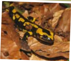
Salamandre tachetée Salamandra salamandra