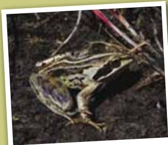
Grenouille des champs

Hersin Coupigny (62) Venez observer et identifier les grenouilles, crapauds et tritons, avec Nœux Environnement - rdv aux étangs d'Hersin Coupigny - sur inscription au 03 21 66 37 74